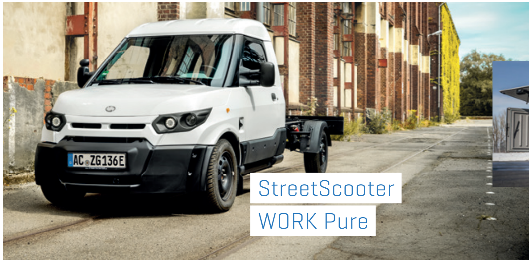
StreetScooter WORK Pure