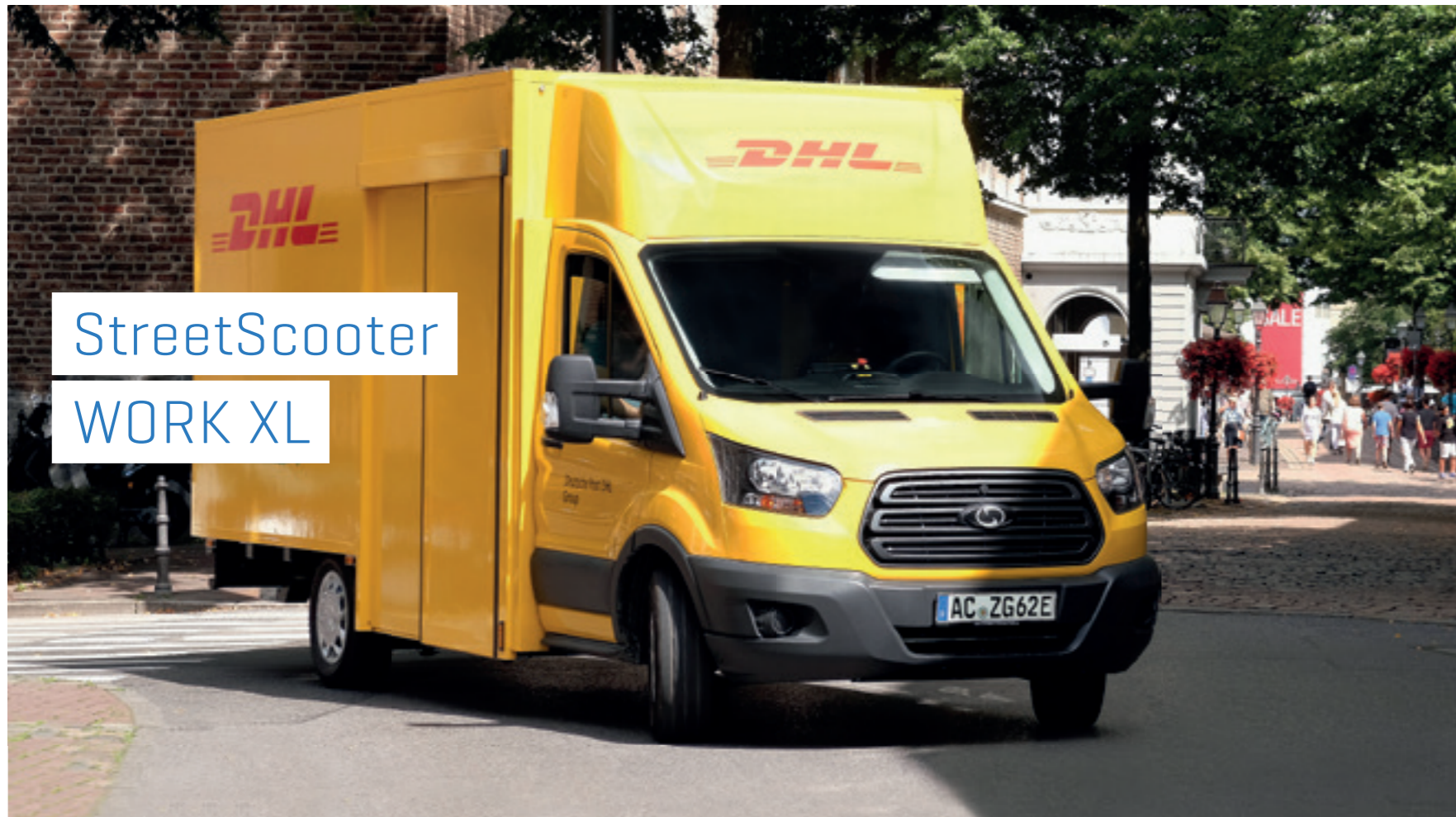
StreetScooter WORK XL