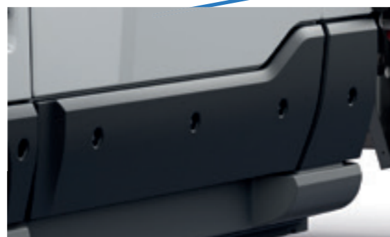
Leicht austauschbarer Anprallschutz